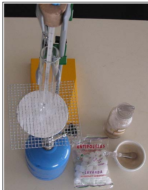
Foto del montaje y material

Para esta práctica puede utilizarse con buenos resultados el p-diclorobenceno que se vende en las droguerías para combatir la polilla. Generalmente es de una pureza de casi el 100%. El naftaleno también puede encontrarse en algunas tiendas, de todas formas es un producto barato.