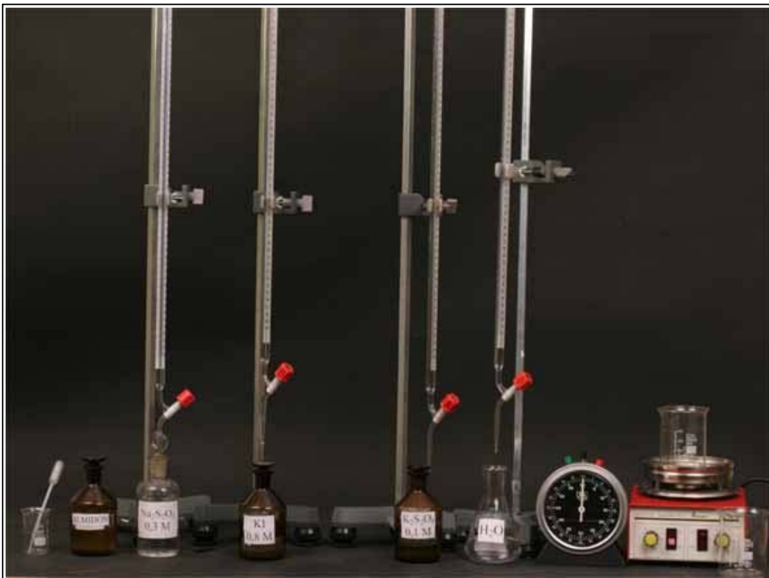
Foto del montaje

En la foto del montaje se ha utilizado peroxodisulfato potásico 0,1M